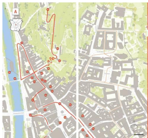
Beispielseiten Architekturführer Graz