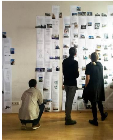
Entwicklung des Architekturführers Graz mit Studierenden