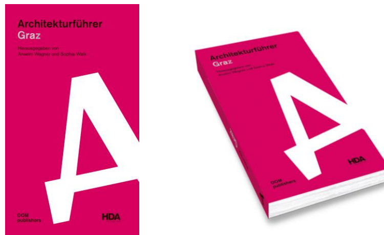
Cover Architekturführer Graz © DOM publishers