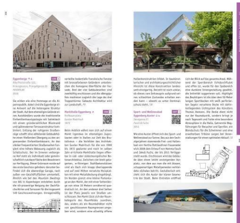
Beispielseiten Architekturführer Graz