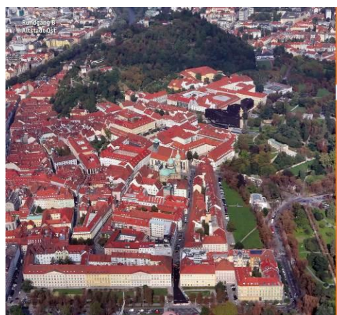
Beispielseiten Architekturführer Graz