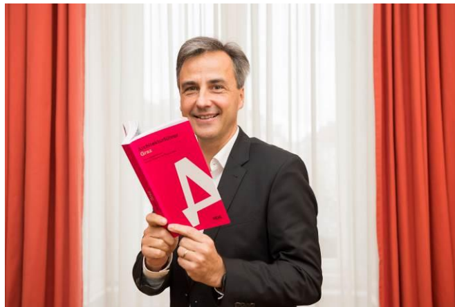
Bürgermeister Siegfried Nagl