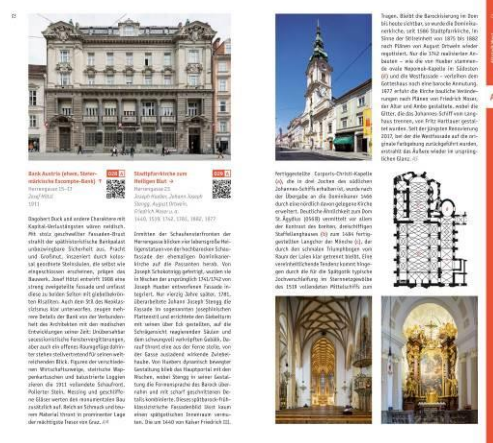
Beispielseiten Architekturführer Graz © DOM publishers