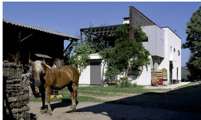
„Parnhansi“ – Umbau und Erweiterung einer Landwirtschaft; Architektur: Peter Zinganel

„Parnhansi“ – Umbau und Erweiterung einer Landwirtschaft, Architekt Peter Zinganel Flughafen Graz, Architekturbüro Pittino & Ortner Impulszentrum Graz-West, Architekt Hubert Rieß Wohnhaus Schmuck, Architekt Hans Gangoly