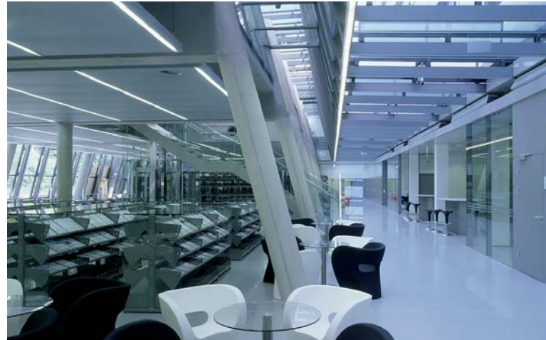
Zentrum für Medizinische Grundlagenforschung; Architektur: Croce–Klug–Kopper

Zentrum für Medizinische Grundlagenforschung, Architekten Croce–Klug–Kopper TDV Umbau Bürohaus, balloon_Rampula/Gratl/Wohofsky Kindermuseum Graz, Architekturbüro Fasch & Fuchs Einfamilienhaus Grabner, projekt.cc