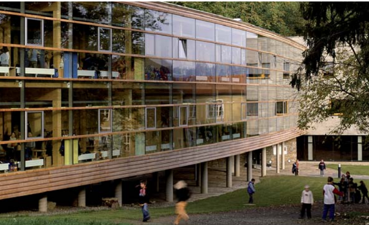
Volksschule Wildon; Architektur: Nussmueller Architekten ZT GmbH

Volksschule Wildon, Nussmueller Architekten ZT GmbH Eurospar Leibnitz, Riegler Riewe Architekten Gemeindezentrum St. Nikolai im Sausal, Architekt DI Gerhard Mitterberger Wohnpark Schloss Eybesfeld, Architekturbüro Plottegg