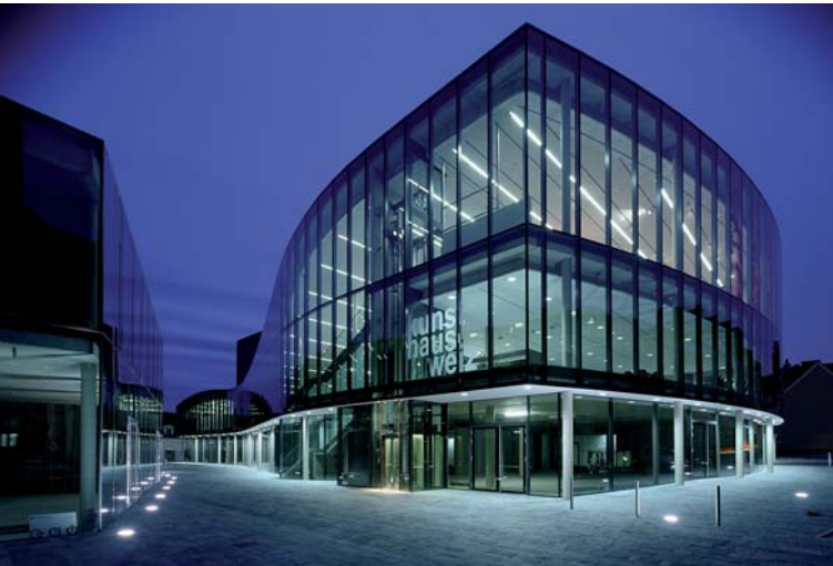
Kunsthhaus Weiz; Architektur: Feichtinger architectes

Volksschule St. Ruprecht an der Raab, Architekturbüro Stingl – Enge Feuerwehrzentrum Weiz, Architekturbüro Gasparin & Meier Kunsthhaus Weiz, Feichtinger architectes TANNO meets GEMINI, Ökologisches Plusenergie-Doppelhaus, Architekt Erwin Kaltenegger