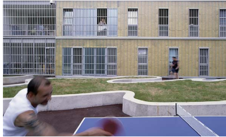
Justizzentrum Leoben; Architektur: Hohensinn Architektur ZT GmbH

Justizzentrum Leoben, Hohensinn Architektur ZT GmbH Kinderkrippe Töllergaben Kapfenberg, Christian Andexer Georg Moosbrugger Architekten Spiel!Raum Musikschule Kapfenberg, Architekturbüro Neugebauer